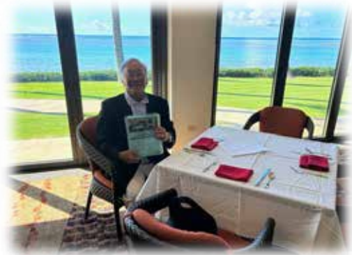
セミナー会場のWaialae Country Club Meeting Room